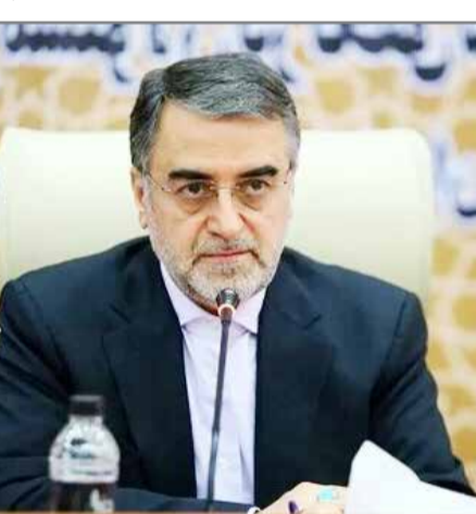
مدیر بهره برداری ادارات شرکت گاز غرب مازندران :

کارنامه مدیریتی اگرچه نوری دانش آموخته رشته مدیریت تخصصی گردشگری است، اما عمده پست های او به حوزه آموزش و پرورش ارتباط داشت و در واقع از خانواده آموزش و فعالیت های اجرایی خود را سال ۱۳۷۰ با پست