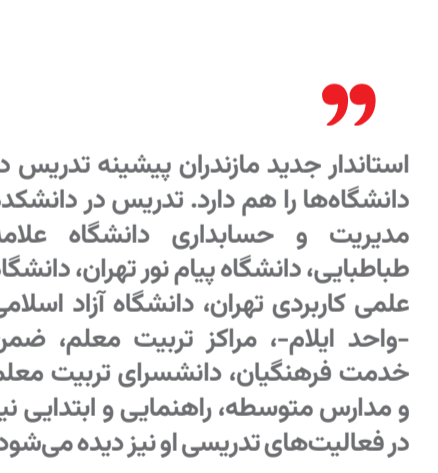
مدیر بهره برداری ادارات شرکت گاز غرب مازندران :

استاندار جدید مازندران پیشینه تدریس در دانشگاه ها را هم دارد. تدریس در دانشکده مدیریت و حسابداری دانشگاه علامه طباطبایی، دانشگاه پیام نور تهران، دانشگاه علمی کاربردی تهران، دانشگاه آزاد اسلامی -واحد ایلام-، مراکز تربیت معلم، ضمن خدمت فرهنگیان، دانشسرای تربیت معلم و مدارس متوسطه، راهنمایی و ابتدایی نیز در فعالیت های تدریسی او نیز دیده می شود.