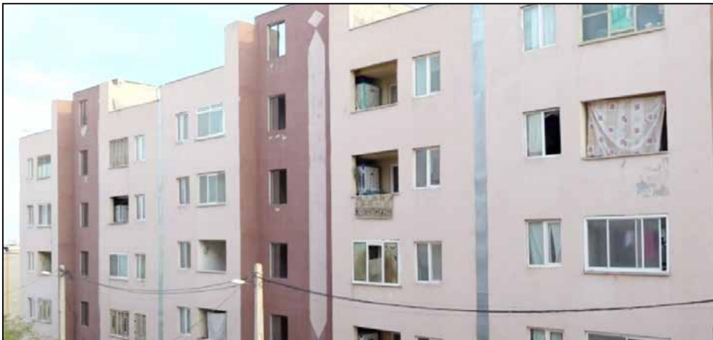
معاون هماهنگی امور عمرانی استاندار سمنان:

رئیس جهاد دانشگاهی استان سمنان افزود: فناوری امیکس به بررسی همزمان تعداد زیادی از یک جز سلولی (مانند ژن، پروتئین، رونویشت و متابولیت) می‌پردازد. آنالیز هم‌زمان سبب می‌شود تصویر کلی‌تر و واقعی‌تری از رونق حوادث سلولی به‌ویژه در سلول‌های سرطانی به‌دست آید و هدف OMICs توصیف جمعی و تعیین کمیت مجموعه‌ای از مولکول‌های بیولوژیکی است که به ساختار، کارکرد و پویایی یک ارگانیسم یا جانداران تبدیل می‌شوند.